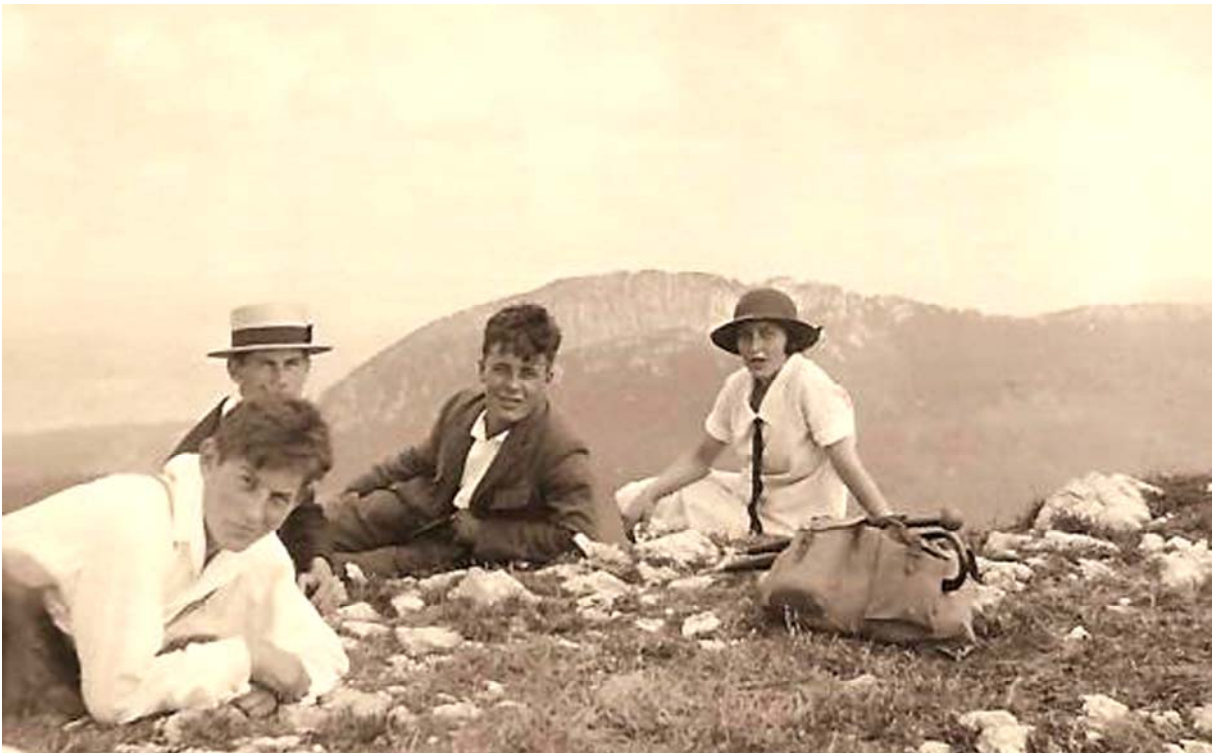
Une pause, sur ce que l'on suppose être le sommet du Suchet.