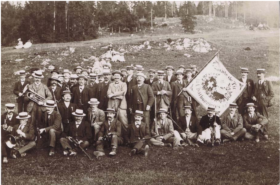
La Société de Tir « Aux armes de guerre » Charbonnières-Séchey le 14 juillet 1907

Mais bientôt aussi les hommes du Séchey purent adhérer à la Société de tir des Charbonnières-Séchey s'activant sous le nom d' « Armes de Guerre » de 1874 à 1974, qui utilisa pour l'essentiel de son activité le stand de tir de la Combe, en dessus des Charbonnières.