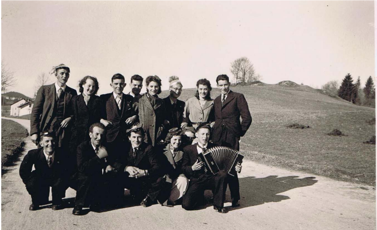
La Fourmi, société de vannerie