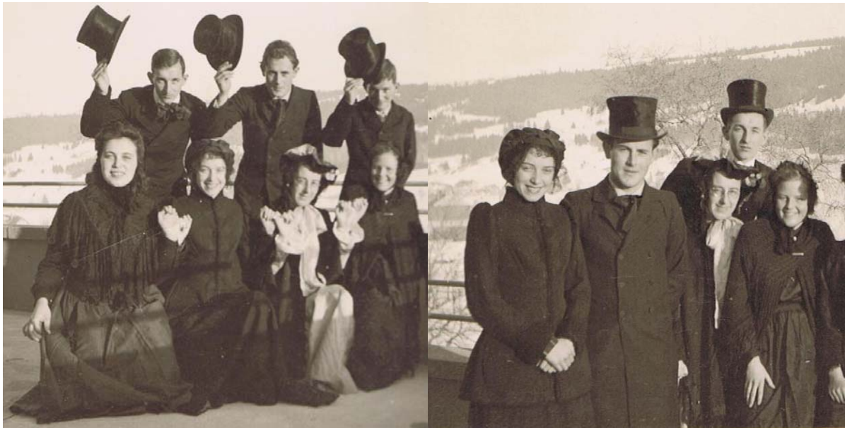
Beaux gars, jolies filles, le groupe a de l'allant...