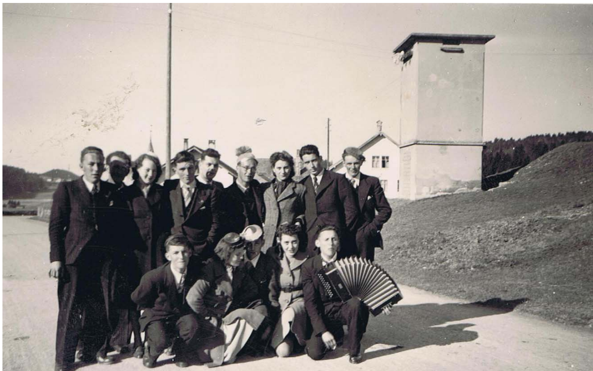
Mais il n'est pas certain que la jeunesse du Séchéy ait toujours voulu être chaperonnée par le pasteur, si sympa celui-ci savait-il être ! On aura reconnu l'endroit, à la sortie du village, du côté du Plat du Séchéy et du Crêt chez Rollier.